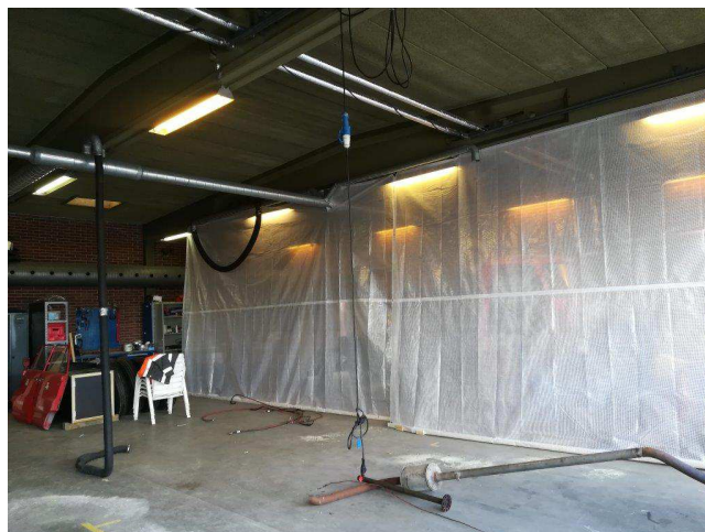
En let skillevæg i garagen

Den nederste del af bagenden på vognen er nu malet sort, og vi kan sætte baghjulene endelig på plads. Bagskærmene er blevet slebet og grundet og skal bare have en let slibning og derefter males - så er de også klar.