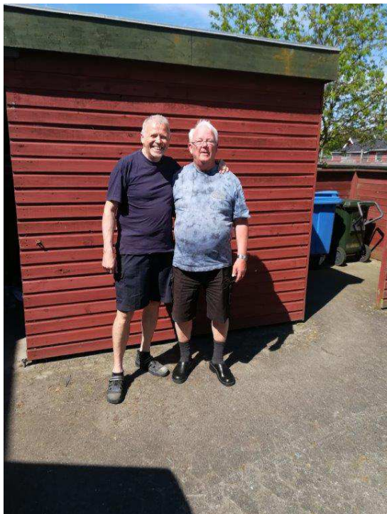
Hvem holder ved hvem

holde ved, og hjælpe over alt hvor han kan. Altid klar til at give en hånd.