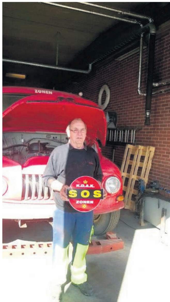
Zonen arbejdede tæt sammen med KDAK. Skiltet her er fundet i den gamle kranvogn.

Det koster 150 kroner om året at være medlem af foreningen.