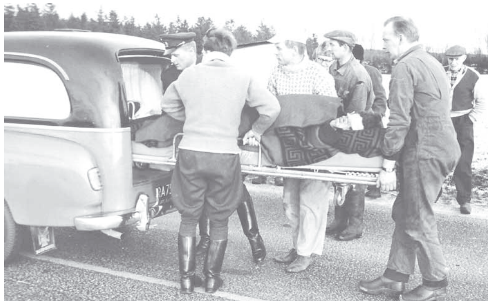
Ambulancekørsel midt i tresserne. Der er sket en ulykke på hovedvej A13 ved Hampen, ambulancen rykker ud og alle hjælper med at få patienten på båret. Ikke noget med behandling, bare af sted til sygehuset. Redderen med spidsbukser er formentlig en cranredder, der lige er kommet hjem fra en tur og ikke har nået at skifte til pæn uniform, men blot har fået kedeldragten af.